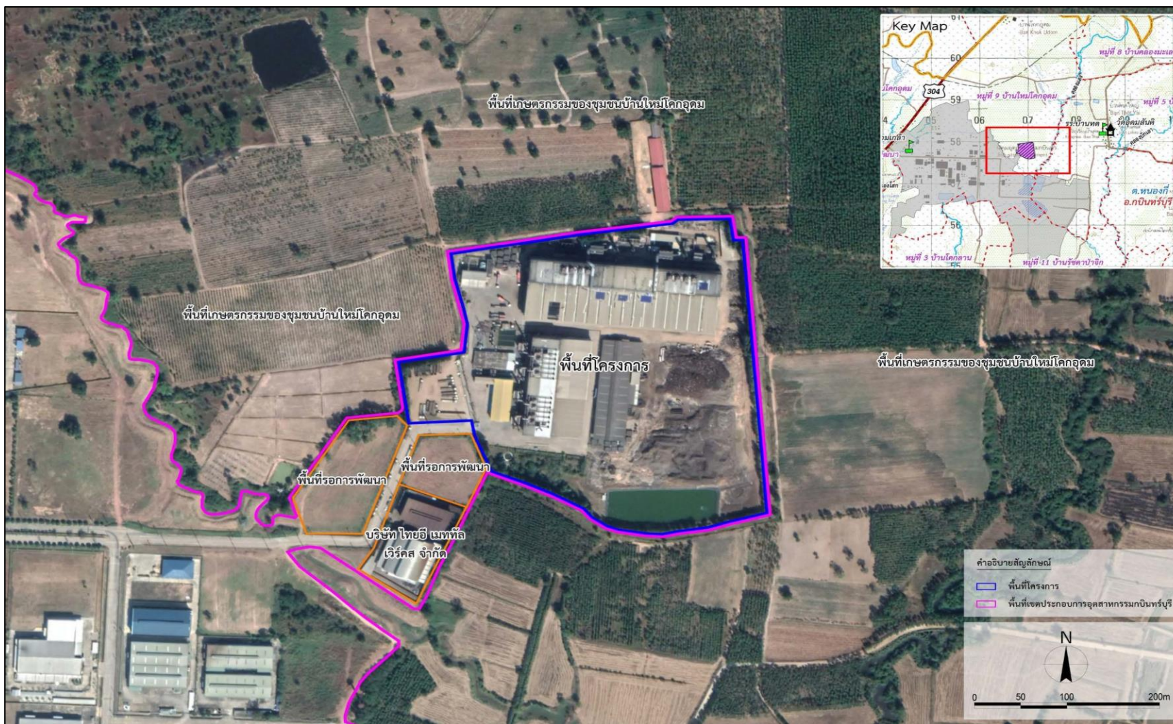
ภาพที่ 1.1 แผนที่แสดงที่ตั้งโครงการ (ต่อ)